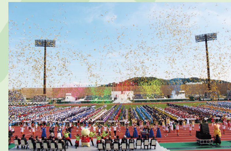
第18回 福井しあわせ元気大会 開会式